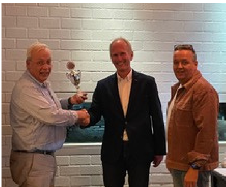
Gemiddeld aantal doelpunten tegen